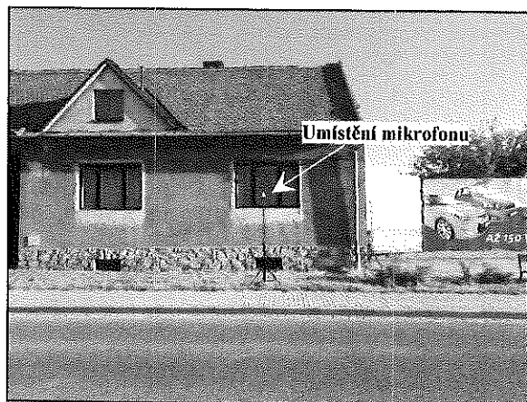
Obrázek č. 2 – Pohled na měřicí místo A