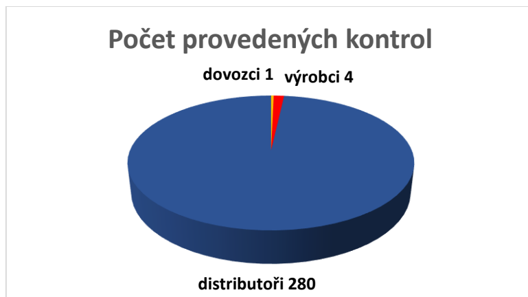
Graf č. 1: Počet provedených kontrol u jednotlivých zodpovědných osob

Ve srovnání s prvním pololetím roku 2020 je, i navzdory pandemické situaci, pozorovatelný nárůst počtu kontrol, který souvisí s personálním posílením oddělení PBU. Stále však jde zhruba jen o polovinu kontrol, které by byly provedeny za pololetí běžného roku. Podobně jako další oddělení bylo i oddělení PBU nasazeno na trasování v systému Chytré karantény.